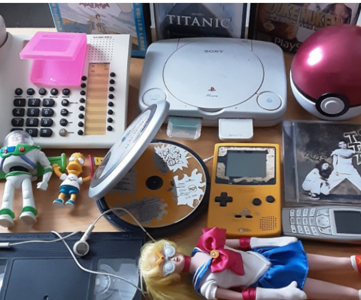
Hausgemacht – Back to the 90s | Foto: Konstantin Langenick